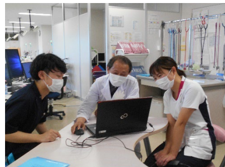
▲透析室でのカンファレンスの様子

看護部の今年度の目標でもある多職種連携に力を入れており、食事制限のあるなかでも少しでも食事が楽しめるように患者さんの嗜好を取り入れた栄養指導を管理栄養士と連携し行ったり、フットケアを皮膚・排泄ケア認定看護師と連携し行っています。